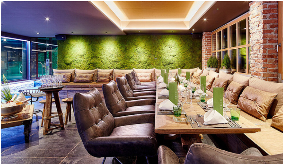
100% pflegefreie Mooswand