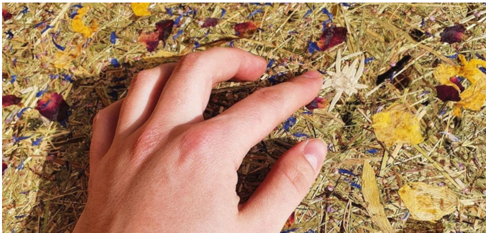
Natur Heutapete mit Blüten & Edelweiß

Leidenschaftlich verbunden mit der Natur